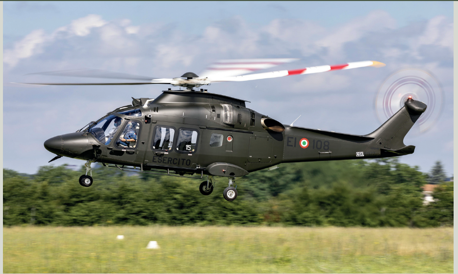
Neues Gerät geplant Das Heer wird in den kommenden Jahren zahlreiche neue Fahrzeuge und Fluggeräte beschaffen. Heuer soll der erste neue Leonardo-AW169-Hubschrauber als Nachfolger der Alouette III zulaufen.

Ausgehend vom aktuellen Budget von rund 2,7 Milliarden Euro werden im kommenden Jahr bereits 3,3 Milliarden Euro (plus 680 Millionen Euro) in das Bundesheer investiert. Bis